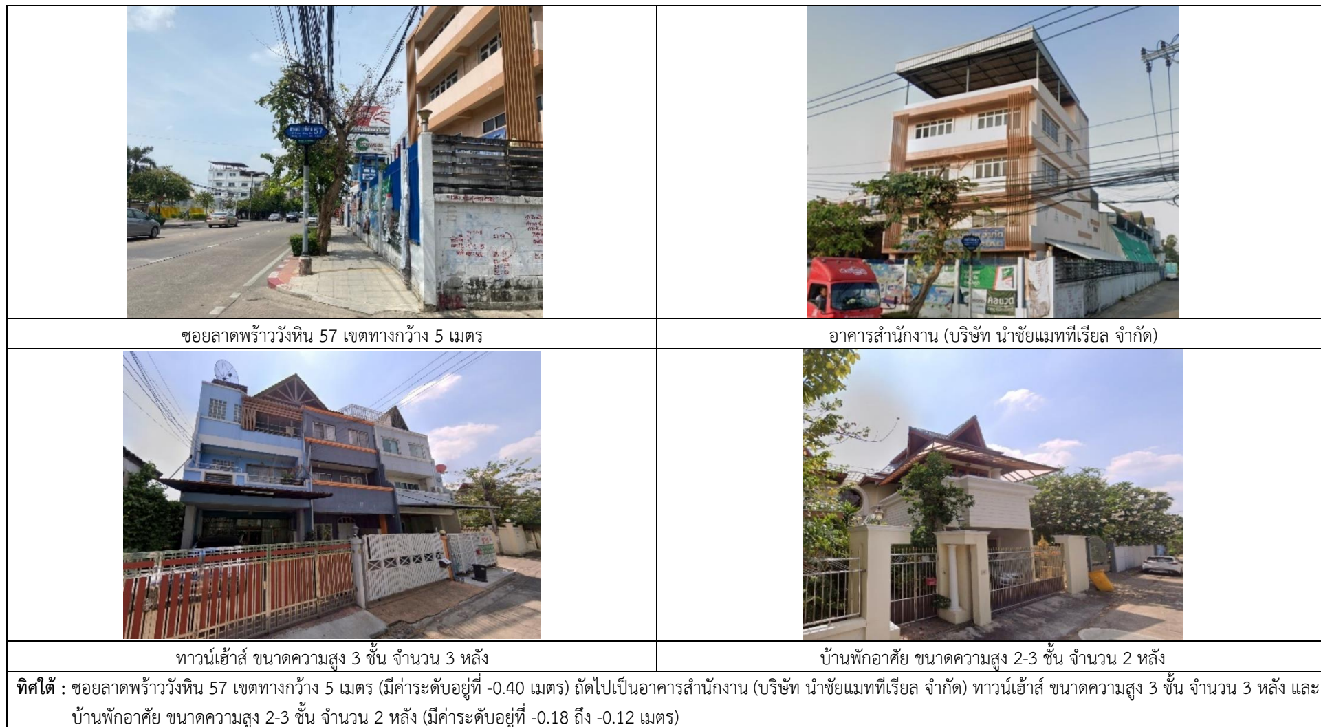
รูปที่ 1.2 ผังแสดงการใช้ประโยชน์บริเวณพื้นที่โครงการและพื้นที่ใกล้เคียง (ต่อ)