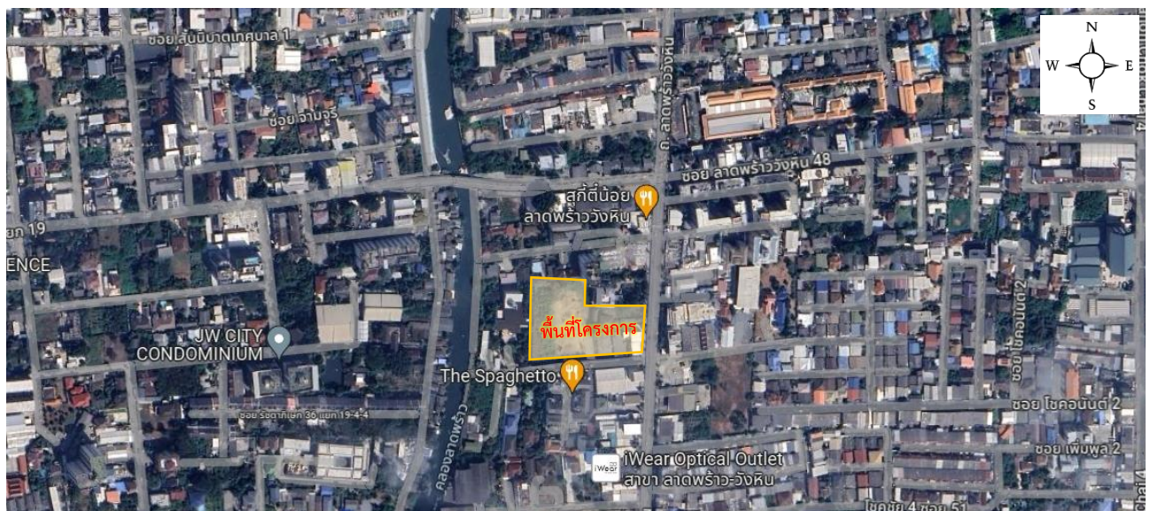
รูปที่ 1.1 พื้นที่ตั้งของโครงการ

รายละเอียดพื้นที่ตั้งของโครงการแสดงดังรูปที่ 1.1 รายละเอียดผังแสดงการใช้ประโยชน์บริเวณพื้นที่โครงการและ พื้นที่ใกล้เคียงดังรูปที่ 1.2 และสภาพโครงการในปัจจุบันดังรูปที่ 1.3